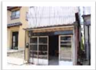
↑お店の外観はこんな感じですよ

11:30 ~ 14:00 18:00 ~ 22:00 (夜は要予約) 定休日 日・月 5台あり 090-8362-7141